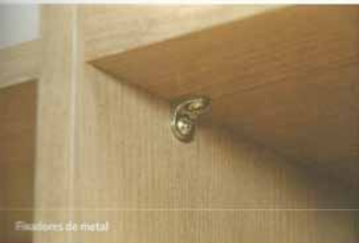
Fixadores de metal