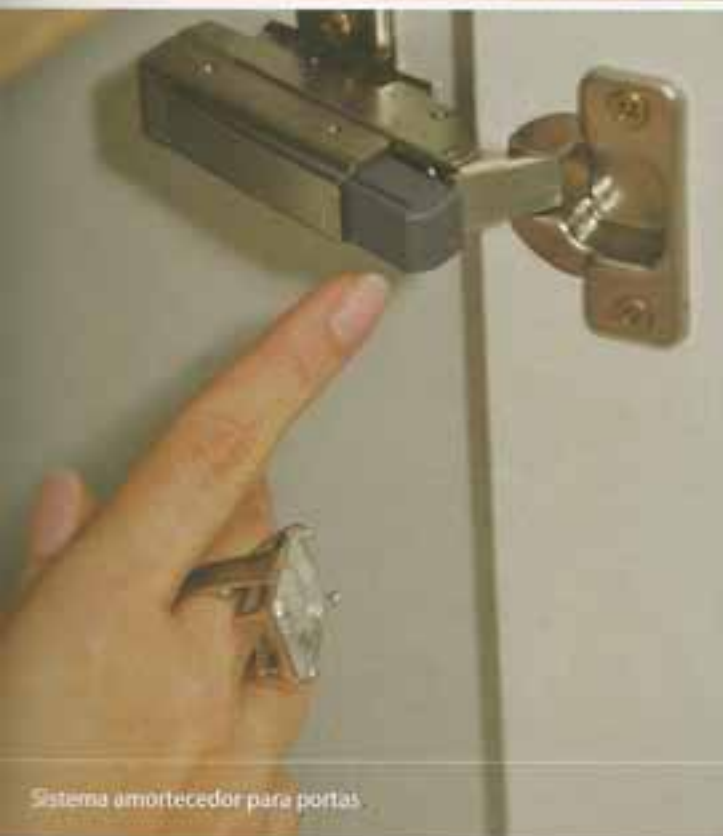
Sistema amortecedor para portas